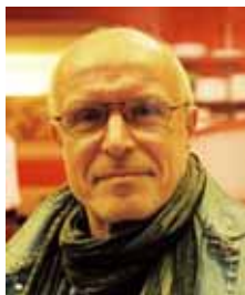
Agricola de Cologne