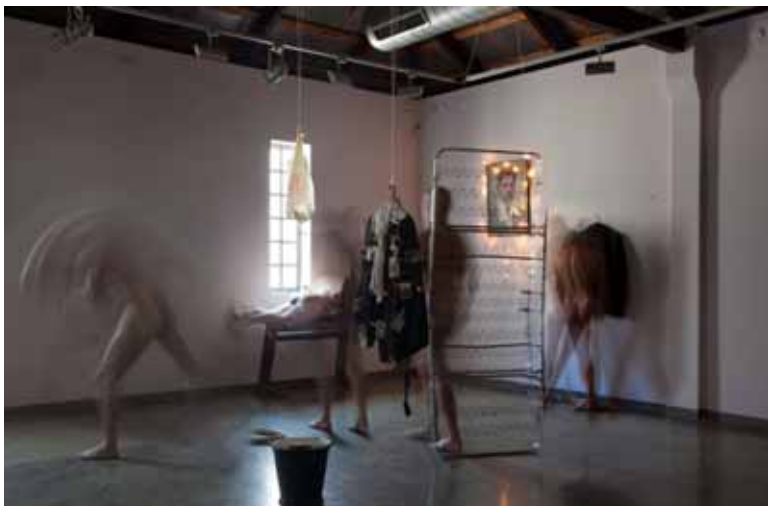
Tas, kurio nebėra (šokio spektaklis Vilniui)