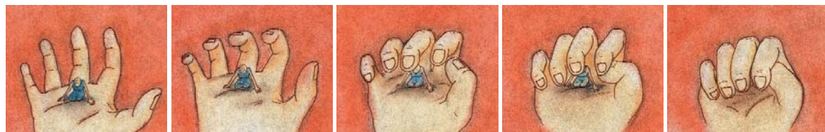
Survivors. Sheila M. Sofian

Sábados de abril, de 11:00 a 14:00 hs. / Dirigido a jóvenes de 13 a 18 años / Participación gratuita previa inscripción. Información: Servicio Pedagógico, tel. 91 774 1000 ext. 2032 / hastadiociocho.mncars@cars.mcu.es