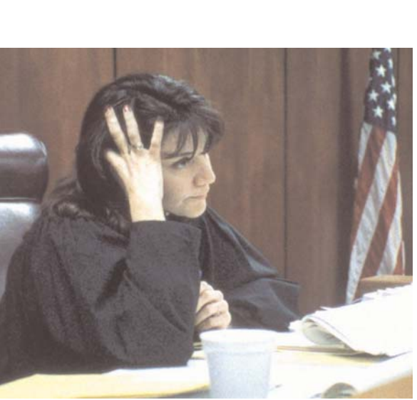
Domestic Violence 2. Frederick Wiseman

Deshaciendo nudos es una vídeo-performance de un trabajo que Beth Moysés realizó en la periferia de São Paulo con un grupo de mujeres y con la Secretaria de la Mujer. “Transportaba tallos de rosas llenos de espinas conmigo y pedía a las mujeres que pensarán en los problemas que vivían mientras arrancaban las espinas”.